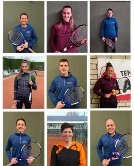
Het ALL-IN lerarenteam staat voor u klaar!

DOE MEE EN GEEF JE NU OP VOOR DE TRAININGEN VAN APRIL T/M SEPTEMBER!